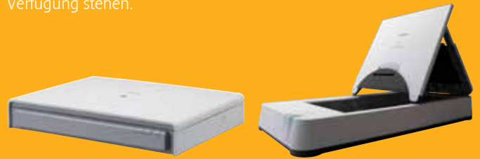
DIN A3-Flachbett-Scaneinheit 201 DIN A4-Flachbett-Scaneinheit 101

Scannen Sie Bücher, Zeitschriften und empfindliche Materialien mit der optionalen Flachbett-Scaneinheit 101 für Formate bis DIN A4 oder der Flachbett-Scaneinheit 201 für Formate bis DIN A3. Diese Flachbett-Scaneinheiten werden per USB verbunden und arbeiten problemlos mit dem DR-6010C zusammen, sodass für jeden Scanvorgang die gleichen Bildoptimierungsfunktionen zur Verfügung stehen.